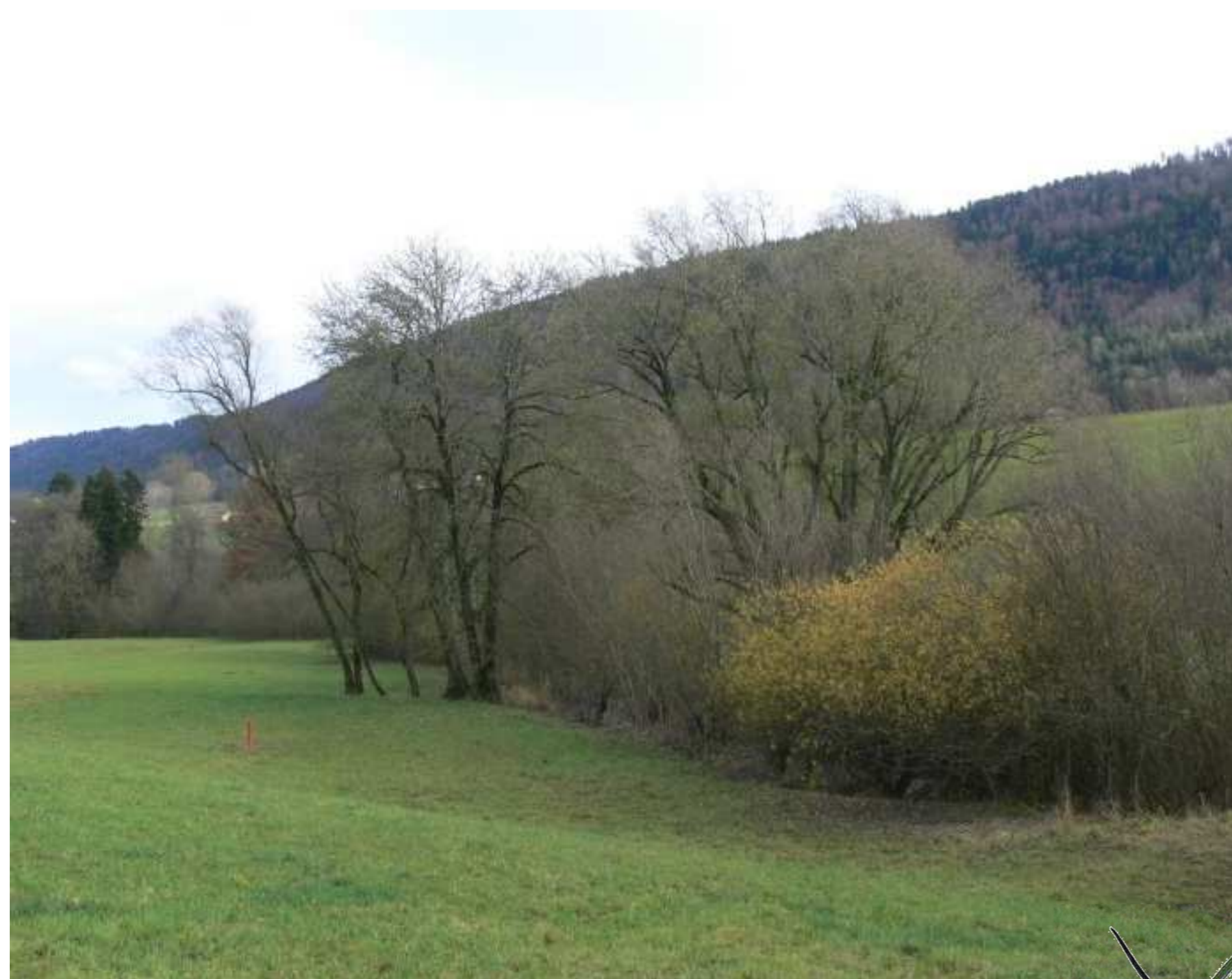
Lieu-dit les Prés Maréchaux au Val de Ruz

La fritillaire aime bien avoir les pieds dans l'eau. Elle pousse donc dans les prairies humides souvent à proximité des cours d'eau qui sont régulièrement inondées durant le printemps.