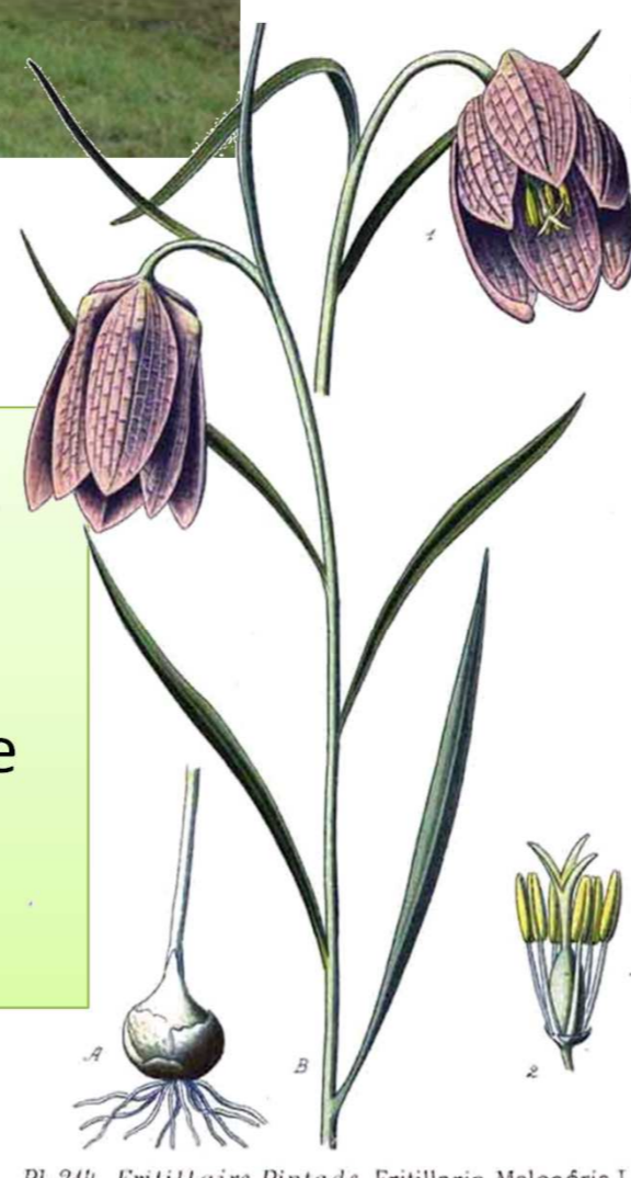
Pl. 314. Fritillaire Pintade. Fritillaria Meleagris L.

Au Val de Ruz, les Prés Maréchaux , situés le long du Seyon en contrebas du village d'Engollon est un des sites où il est possible de la rencontrer. Provenant probablement d'une introduction de quelques plants des Goudebas à la fin du 19 ème et début du 20 ème siècle, les individus qui demeurent encore aujourd'hui bénéficient de mesures afin de pérenniser ce site.